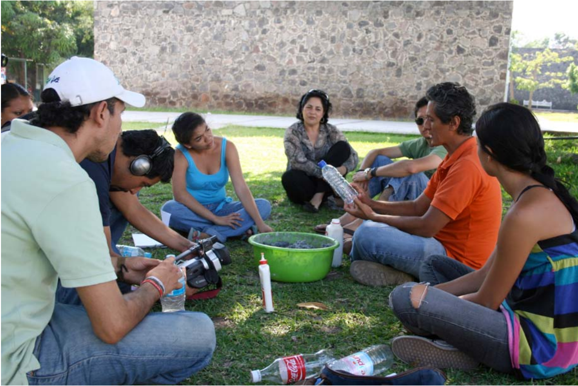
Taller "Reciclarte. Aprovechamiento de materiales"