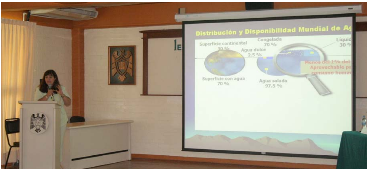
Mesa Redonda. "Conservación de los humedales en Colima"