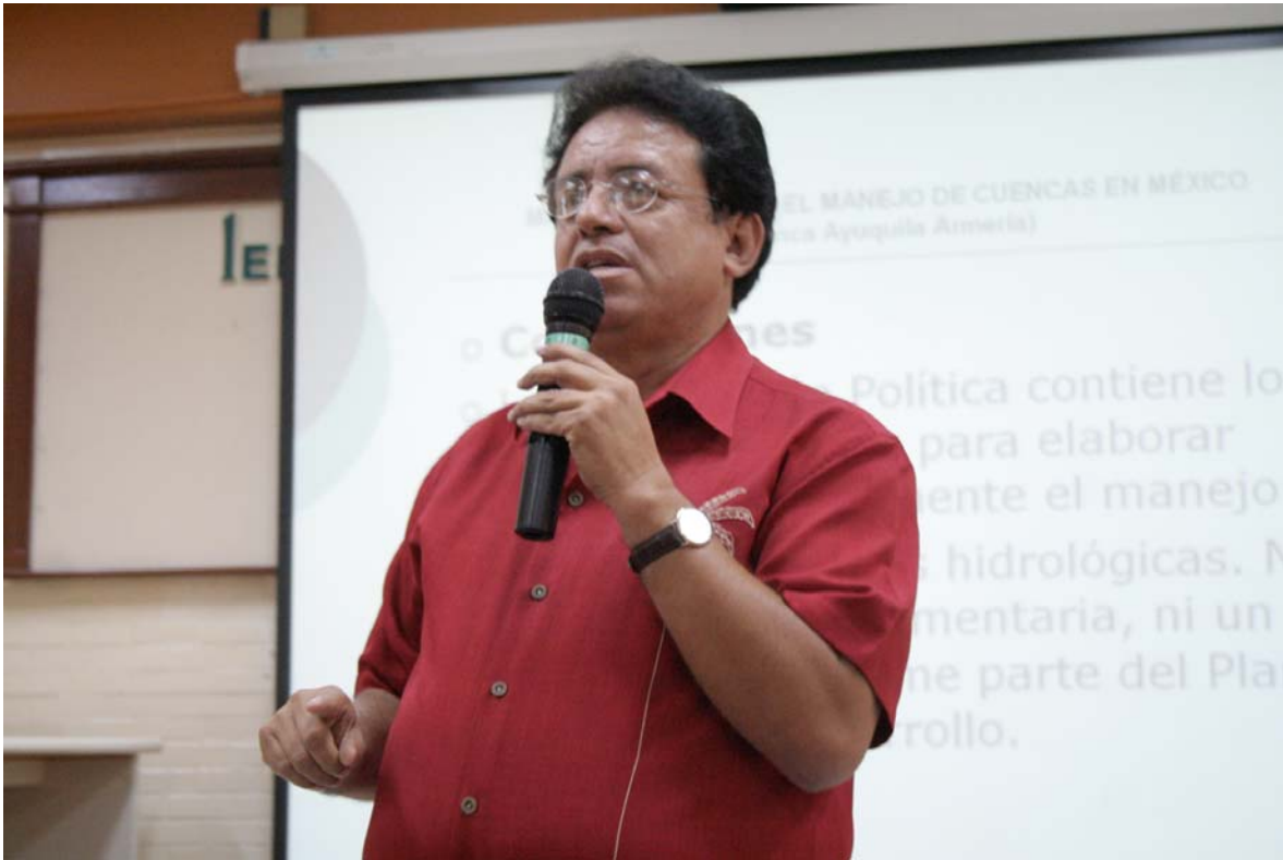
Mesa redonda "Leyes y marco regulatorio de la Cuenca del Río Ayuquila- Armería"