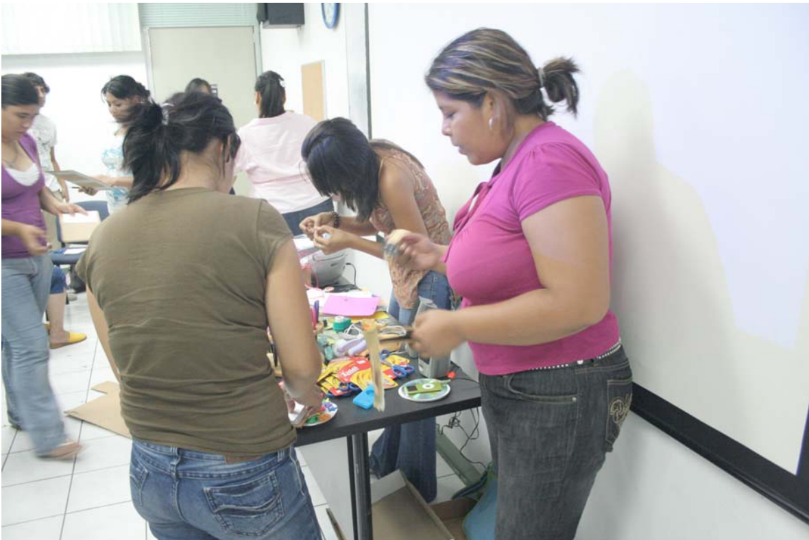
Taller "Creación artística R3 (Reciclo, Reuso y Reutilizo)"